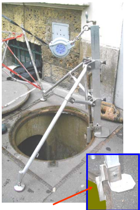
Plaque d'appui du Mobil'Grip.

Le Mobil'grip est l'outil idéal pour les interventions de type, cheminement.