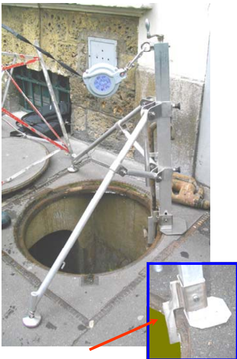
Plaque d'appui du Mobil'Grip.

Le Mobil'grip est l'outil idéal pour les interventions de type, cheminement.